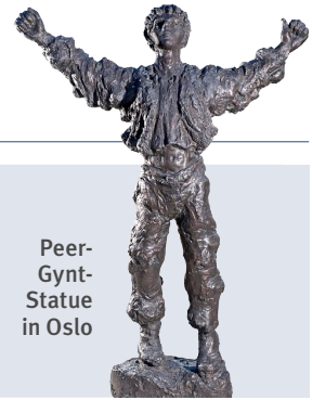
Peer-Gynt-Statue in Oslo